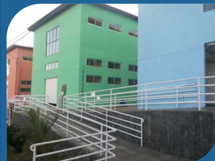
Residencial Gurungas Guanambi-BA