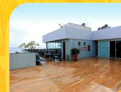
Propeg (Ampliação e Reforma da Sede) Propeg Comunicação S.A.