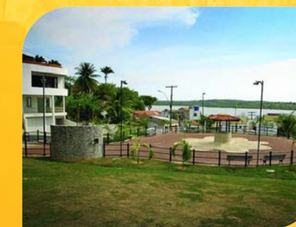
Infraestrutura e Paisagismo Urbano São Francisco do Conde