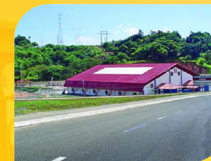
Centro Esportivo Gal Costa Conder