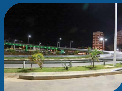
Viadutos do Imbuí Salvador-BA