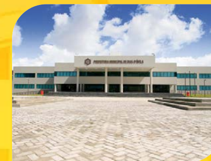
Centro Administrativo de Dias D'Ávila Prefeitura Municipal de Dias D'Ávila