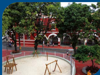
Urbanização e Infraestrutura Salvador-BA