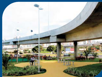
Complexo Viário do Imbuí Governo do Estado da Bahia