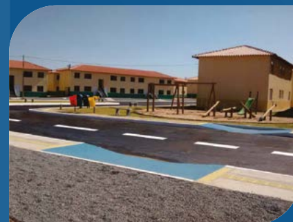
Residencial Vista Alegre Luís Eduardo Magalhães-BA