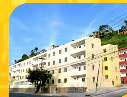
Infraestrutura, Urbanização e Habitação do Pilar Conder