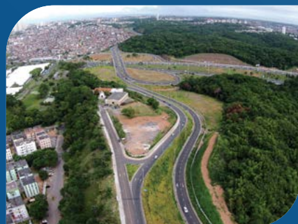
Ligação Stiep X Luís Viana Filho (Curralinho) Governo do Estado da Bahia