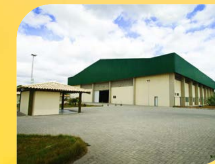
Complexo Esportivo Princesa do Sertão Prefeitura Municipal de Feira de Santana