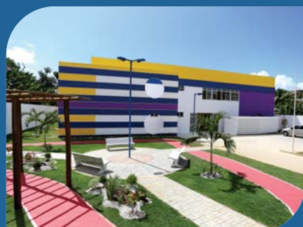
Escola Municipal Padre M. C. de Souza Salvador-BA