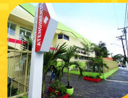
Hospital Célia Almeida Lima Prefeitura Municipal de São Francisco do Conde