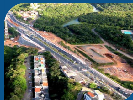
Duplicação da Av. Pinto de Aguiar Salvador-BA