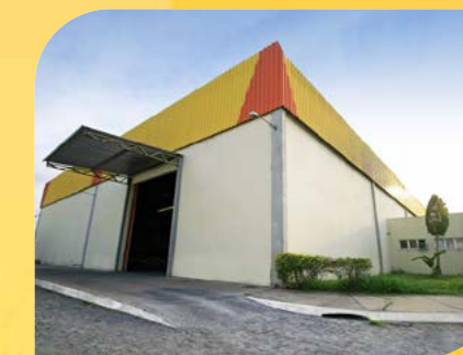
Construção da Sede da Indústria Alfa Trefile Patrimonial Dias D'Ávila